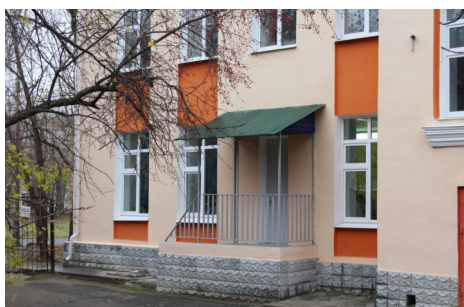
Здесь долгое время была библиотека, а сейчас спортивный зал

Начальная школа, как и сейчас, находилась на первом этаже. Она не была такой большой, так как включала в себя три года обучения. Кабинет директора и кабинет медицинских работников были там, где сейчас нахо-